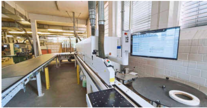
/ Kante gut, alles gut: Vor drei Jahren investierte die Tischlerei in die Kantenanleimmaschine Edgeteq S300 von Homag samt Rückführung für den 1-Mann-Betrieb.