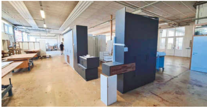
/ Im Bankraum wird vormontiert, damit auf der Baustelle alles glatt läuft. Hier hat jeder Mitarbeiter seinen eigenen Arbeitsplatz samt Werkzeug und Hubtisch.