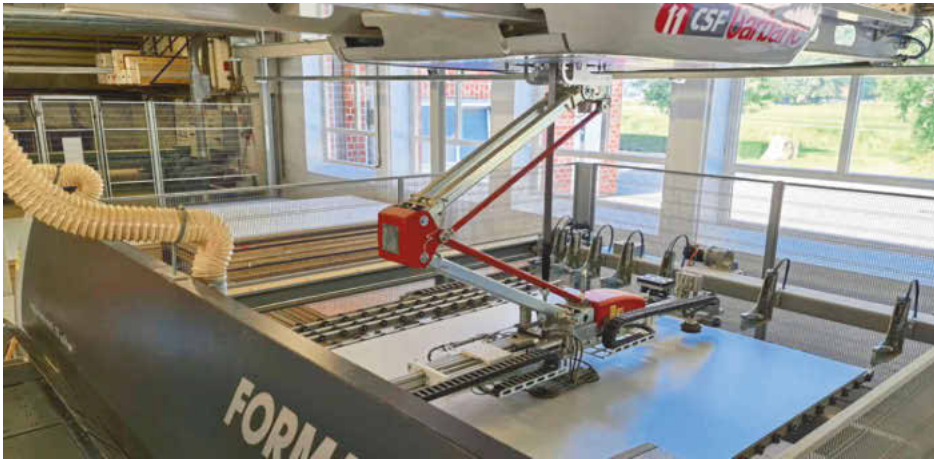
Das automatische Plattenlagersystem CSF Professional von Barbaric befördert die benötigten Platten per Knopfdruck direkt zur Format 4 Plattenaufteil- und Druckbalkensäge vom Typ Kappa Automatic 80.