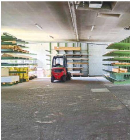
/ Vor der neuen Säge-Lagerkombination benötigte die Tischlerei ein extra Plattenlager mit 160 m 2 .