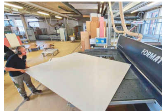
/ Durch den Luftkissentisch an der Format 4 Kappa Automatic 80, lassen sich Platten ganz einfach von einer Person bewegen.