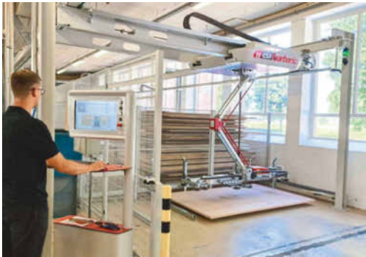
/ Platteninformationen lassen sich direkt am Terminal in die Lagersoftware eingeben. Eingelagert wird dann automatisch.