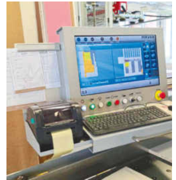
/ Die Säge-Software ist übersichtlich und lässt sich intuitiv bedienen.