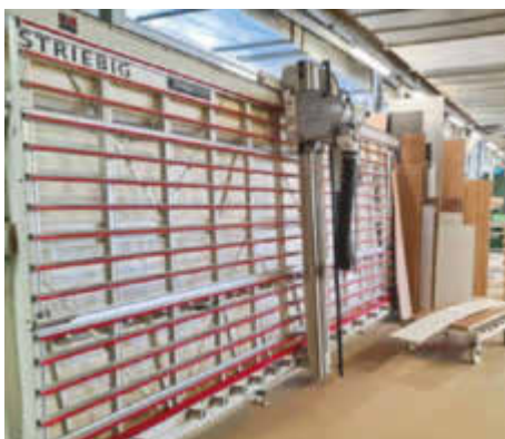
/ Von stehend zu liegend: Die alte stehende Plattensäge ist heute nur noch selten im Einsatz.

automatisch jedes Etikett zum soeben geschnittenen Teil gedruckt. Der Bediener muss das Etikett nur noch aufkleben und das zugeschnittene und gelabelte Teil ab stapeln.