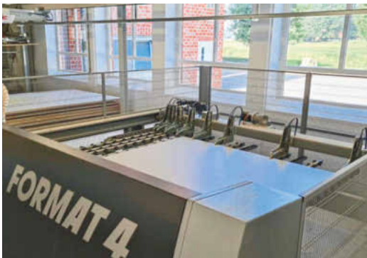
/ Spannanzgen bewegen bis zu vier Platten gleichzeitig und sorgen dafür, dass Teile maßhaltig geschnitten werden.