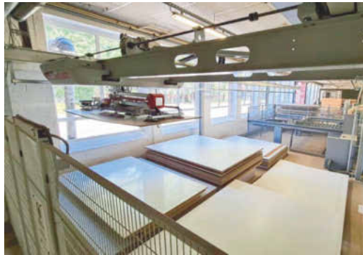
/ Während die liegende Plattensäge in Betrieb ist oder steht, organisiert sich das Plattenlager bei Bedarf automatisch neu.