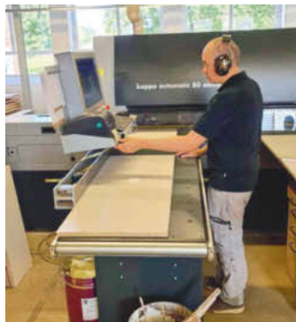
/ Jedes geschnittene Teil wird direkt mit dem passenden Etikett gelabelt.